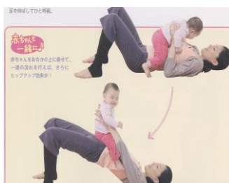
↑橋のポーズ・・・ヒップアップ・骨盤を締める