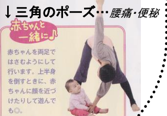
↓三角のポーズ・・・腰痛・便秘