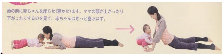
↑コブラのポーズ・・・背骨の矯正・骨盤を締める

★親子体操・リトミック・・・地区センターや区のスポーツセンター等で実施しています(時期によって募集が異なります)。親子で一緒に音楽に合わせてたりしながら、体を動かしたりトレーニングをしたりする触れ合いの時間です。